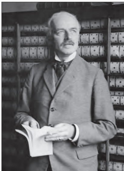
Afbeelding 34 R. Bijlsma, algemeen rijksarchivaris. Foto 1932.