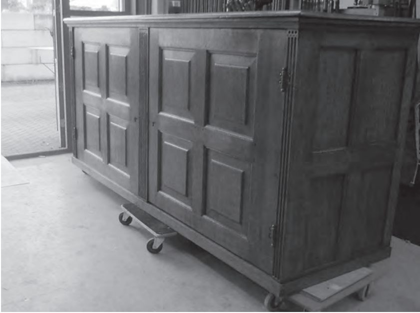
Afbeelding 46 en 47

De Secrete Kas van de Staten-Generaal. De kast bestaat uit twee gedeelten. Een deel bevond zich van oudsher op het Nationaal Archief en is in oktober 2013 na wat omzwervingen en na restauratie in de permanente tentoonstelling 'Het Geheugenpaleis' opgenomen. We zien hem op afb. 46 bij de restaurator staan. Het andere deel, met het binnenkastje waarin de ratificatie van de Vrede van Munster en het groot-