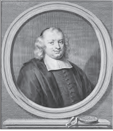
Afbeelding 38 Gaspar Fagel, 1634-1688, griffier 1670-1688. Geschilderd door Johannes Vollevens I.