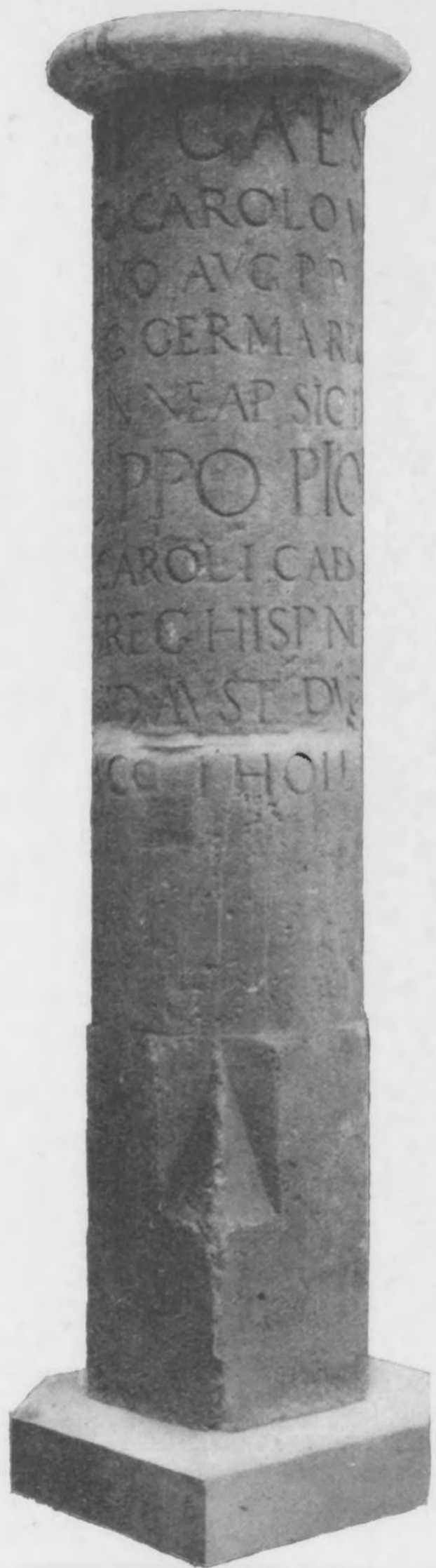
Afb. 7. Pendant van den mijlpaal van Monster-Naaldwijk. De dekplaat is die van Afb. 4.