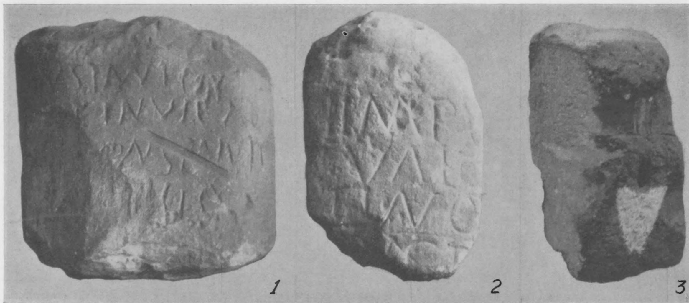
Afb. 10. De beide mijlpalen van Egelshoven (1, 2) en het basement uit Rimburg (3).