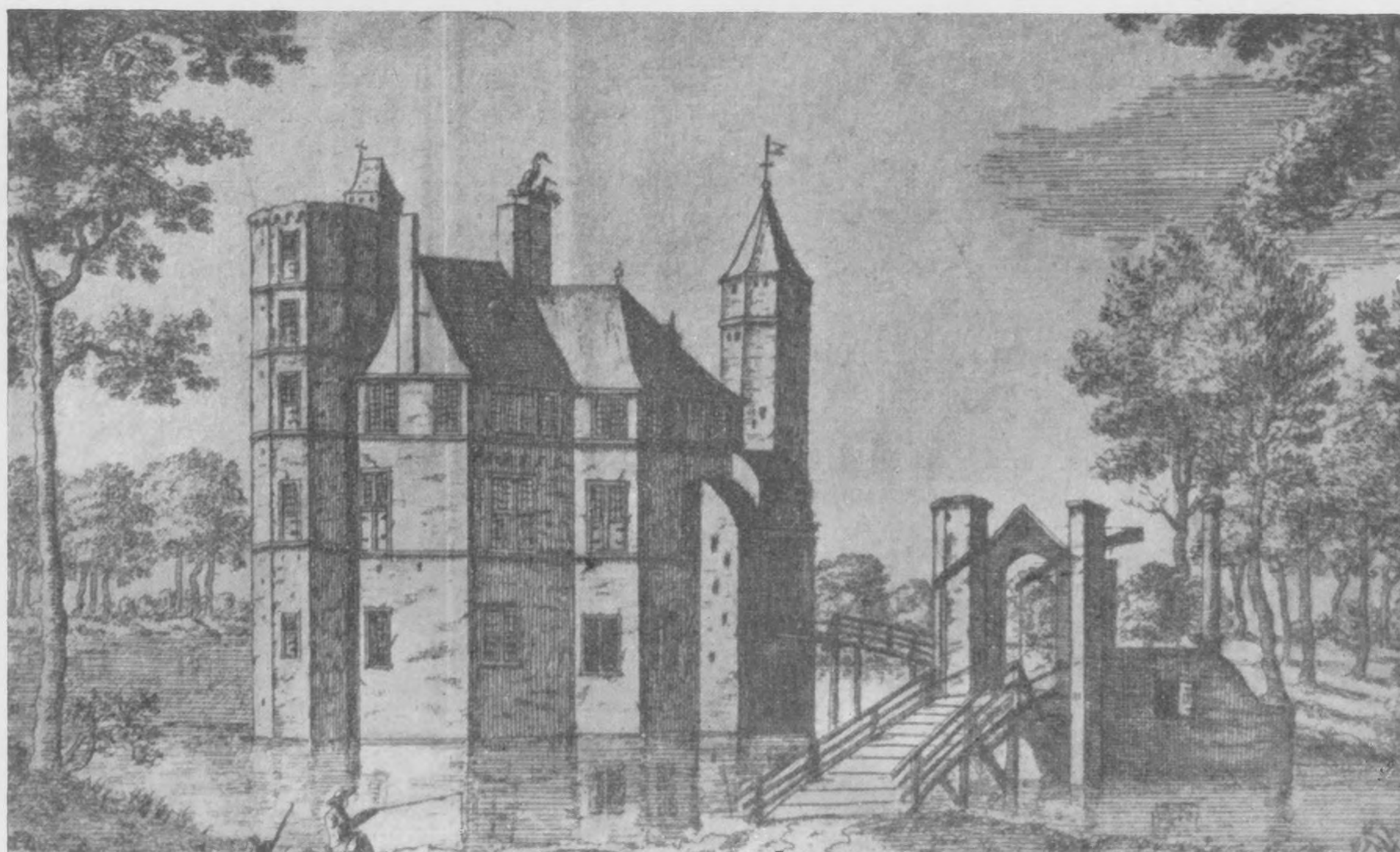
Afb. 6. Het huis Persijn naar een gravure (Gem. Archief Leiden No. 91978).

Volgens het onderschrift van teekening Gem. Archief 91981 stellen de pijlers aan weerszijden van den ophaalbrug den mijlpaal voor, met zijn pendant. De zuil rechts daarvan is de „Antiquiteiten” II.1.135 genoemde.