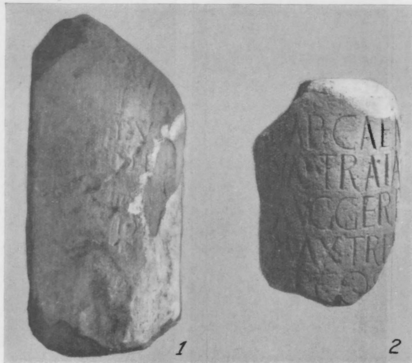
Afb. 9. De beide mijlpalen uit Nijmegen, C.I.L. XIII 9164 en 9162.