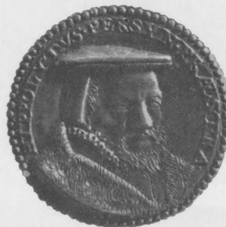
Afb. 8. Legpenning van Persijn, naar foto Penningkabinet.